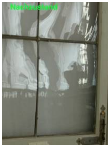
Im Nachzustand ist paßt sich die Ergänzung ideal dem historischen Bestand an.