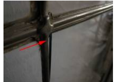
Deutlich sieht man, welche Belastung die normalen Floatglasscheiben für das originale Bleinetz bedeuten.