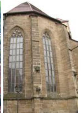
Die ASV von nII und nIII

Der Hauptbestandteil des Restaurierungskonzeptes sah vor, die Chorfenster mit einer innenbelüfteten Außenschutzverglasung (ASV) zu versehen. Erst durch eine vom Innenraum aus hinterlüftete ASV können die Glasmalereien wirkungsvoll konserviert werden und moderne Konservierungsmöglichkeiten sinnvoll eingesetzt werden.