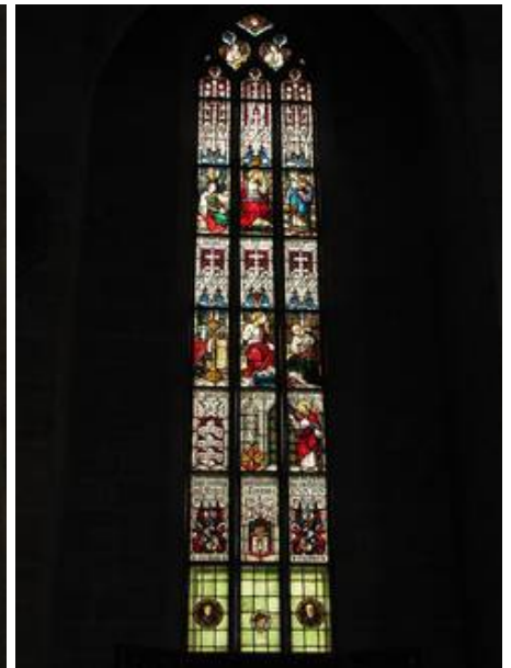
Fenster nV sitzt in einer Seitenkapelle