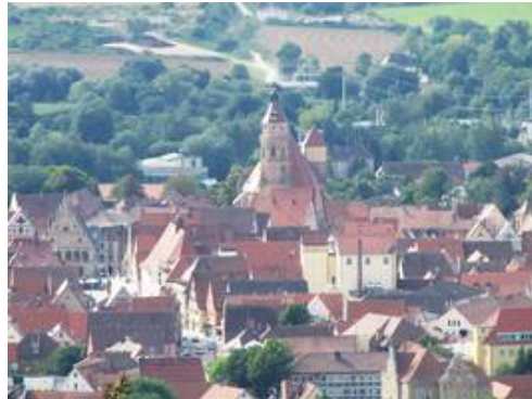
St. Andreas prägt das Stadtbild von Weißenburg

1425 wird dieser Bauabschnitt, der spätgotische Chor, fertiggestellt. Da aber nun das Geld ausgeht, verbindet man diesen Chor mit dem vorhandenen Langhaus. So erhielt St. Andreas seine charakteristische Form, die im Laufe der Jahrhunderte durch weitere An- und Umbauten zum heutigen Gesamtbild führte.