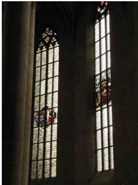
Fenster sII und sIII befinden sich im Chor