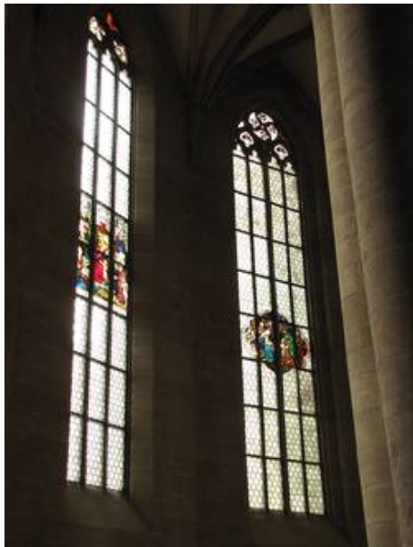
Fenster nII und nIII und