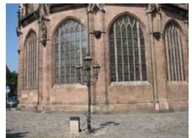
Außenansicht des Kaiserfensters (rechts) im Vergleich zu den anderen Fenstern.