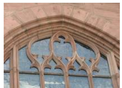
Durch den einscheibigen Aufbau sind auch komplizierte Scheibenformen wie im Maßwerk möglich.