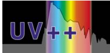
Der UV++Schutz der weiter denkt!

Nach dem Einsetzen der Schutzverglasung präsentiert sich das Kaiserfenster optisch innen sowie außen fast unverändert: Reflexion und »Durchsicht« erscheinen unverändert. Die Farbwiedergabe und die Farbbrillanz der Glasmalerei werden durch die Schutzverglasung nicht beeinträchtigt.