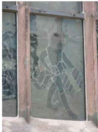
Die bewegte Glasoberfläche der Schutzscheiben wird der historischen Architektur gerecht