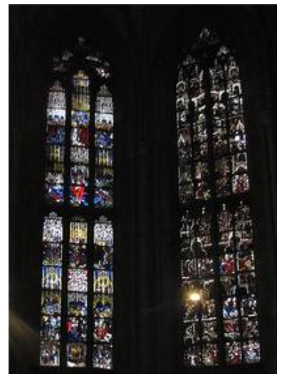
Die Fenster OI und SII

Mit seinem 161,53 m hohen Turm - dem höchste Kirchturm der Welt - gehört das Münster zu Ulm wohl in den Kreis der berühmtesten Kirchen der Welt. Es beherbergt viele bedeutende Kunstwerke des Spätmittelalters.