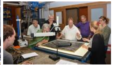
Besprechungen mit dem Fachgremium sind ein wichtiger Meilenstein der Maßnahmen