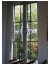
Ein Fenster im Nachzustand