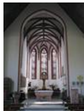
Nachzustand des Innenraumes