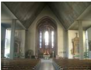
Vorzustand des Innenraumes vor den Arbeiten 2007/2008