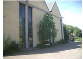
Ein Fassadendetail der Kirche im Vorzustand