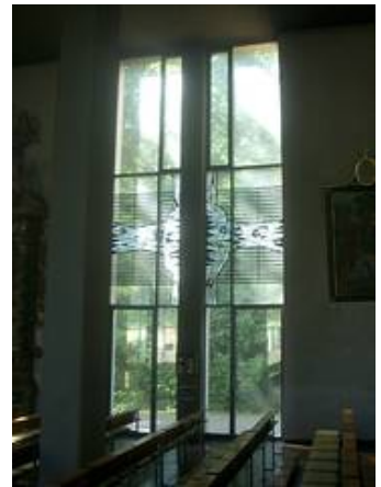
Ein Fensterelement im Vorzustand