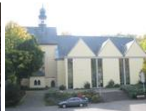
Aussenansicht im Nachzustand