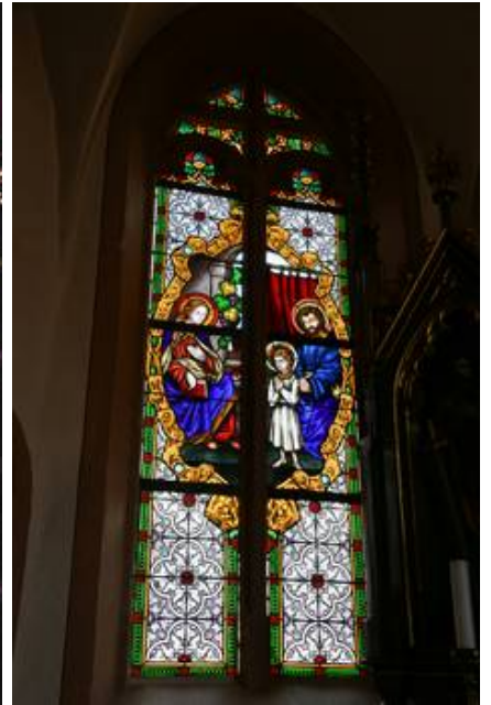
Das neue Fenster nll