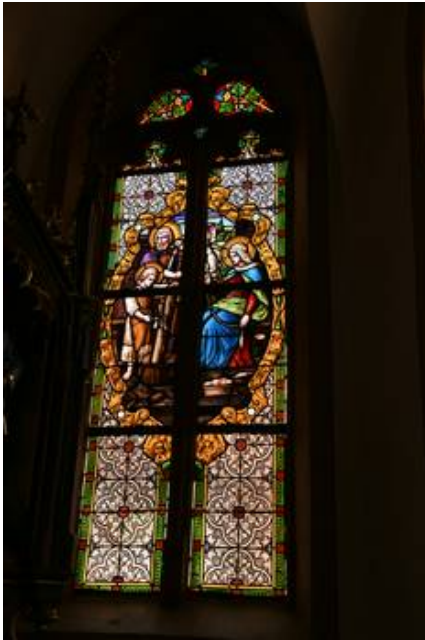
Das vorhandene Fenster sll