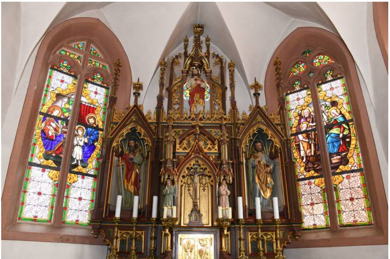
Übersicht des, nun wieder harmonischen Gesamtensembles mit Altar und beiden Fenstern