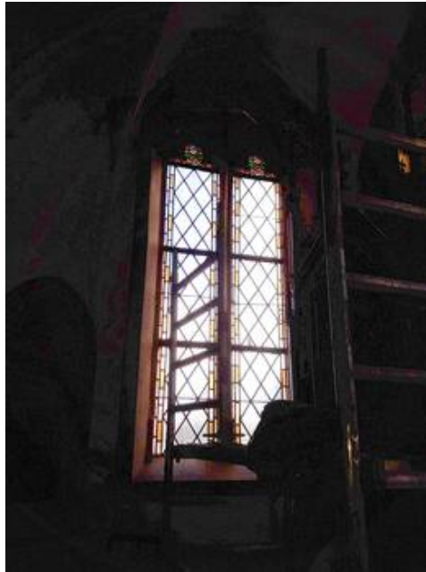
Das Fenster nll im Vorzustand