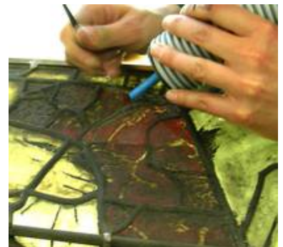
Abreinigung von Verschmutzungen unter ständigem Absaugen zur Minimierung der gesundheitsgefährdenden Stäube.