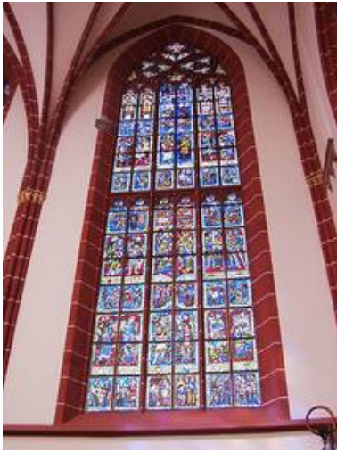
Das Fenster NWV "Stadtfenster", Stifter: Stadt Oppenheim und Vereine, private Spender und evangelische Kirchengemeinde, entstanden 1980, Gestaltung Heinz Hindorf, Michelstadt