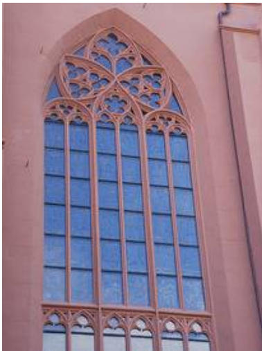
Der obere Bereich des Fensters NWV von aussen.