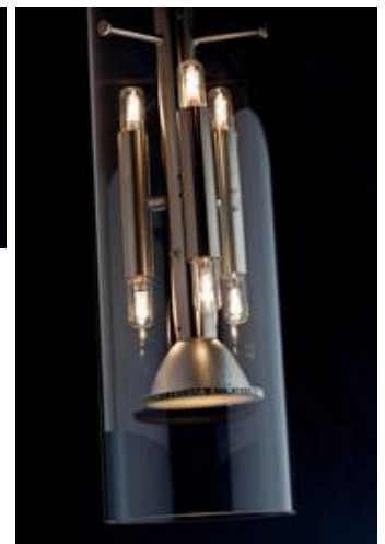
ML 04/P 2-7 mit klarem überlagem Glaszylinder und Blendraster