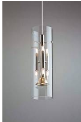
ML 04/P 2-7 mit klarem überlagem Glaszylinder

Der teilmattierte Glaszylinder hat sogar eine Höhe von 70 cm.