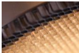
Das Blendraster kann mit verschiedenen Leuchten

Inwieweit das Raster eine Auswirkung auf die Bestückung des Downlights hat wird aktuell mit Kontrollmessungen untersucht.