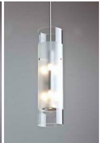
ML 04/P 2-7 mit mattem überlagem Glaszylinder