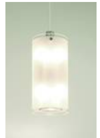
ML 04/P 2-7 in der Standardausführung

Hier finden Sie einige der jüngsten Modifikationen der ML 04/P 2-7.