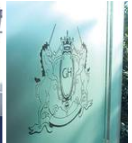
Hotellogo in Badezimmertür