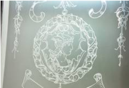
Kombinierte Sandstrahl-Ätz-Technik, Replike einer historischen Scheibe in einem Hotel

Hochwertige Ware brauchen hochwertige Scheiben!