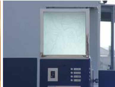
Tiefstrahlarbeit in Toranlage einer Firma