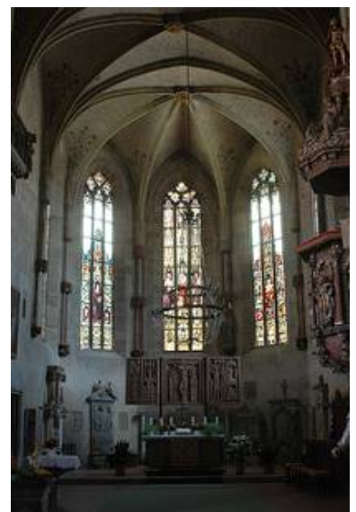
Der Chor von innen nach den Arbeiten