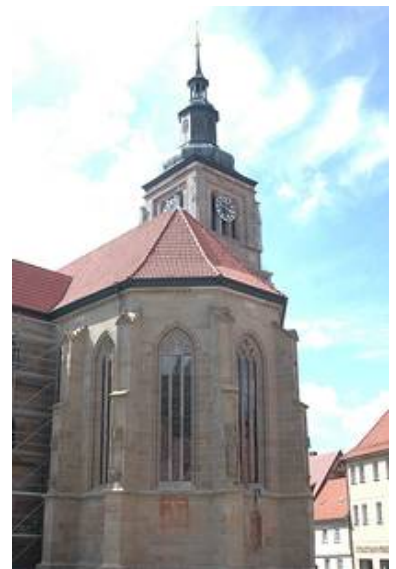
Der Chor von Außen nach den Arbeiten

Auch hier war es uns wichtig durch umfassende Besprechungen mit dem Bauherrn und dem Landesdenkmalamt ein gutes Restaurierungskonzept gemeinsam zu erarbeiten.