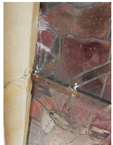
Auch der zunehmende Rostdruck durch die Eisen und die Schäden am Sandstein machten einen Ausbau der Glasmalereien dringend nötig