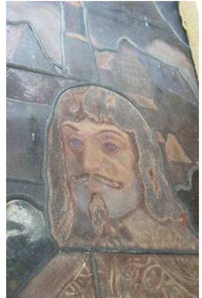
Diese Aufnahme der Malschichten läßt die Bedeutung einer Außenschutzverglasung nach dem derzeitigem Stand der Technik erahnen