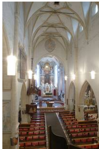
Lienz (A) - kath. Kirche St. Andrä