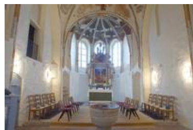
Hankensbüttel - evang.-luth. Kirche St. Pankratius