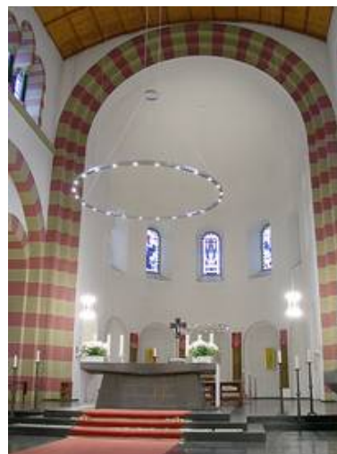
Köln - St. Michael

Weitere Informationen zum Thema sinnvolle Beleuchtung finden Sie auch im Bereich Lichtplanung .