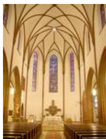
Berlin Tegel - Kath. Kirche Herz Jesu