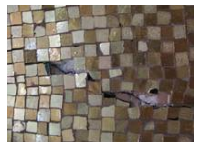
Risse im Mauerwerk führten zu einer Beschädigung des Mosaiks und zu einem Abplatzen der ca. 6x6mm aus blau-grünem Grundglas mit aufgelegtem Blattgold und überschmolzenem Deckglas gefertigten Steinchen