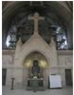
Über der Altarapsis thronet die Nordempore mit der Orgel

München an der Akademie der Bildenden Künste zu studieren. Anschließend schlug er entgegen des Vaters Vorstellungen zur Übernahme des Malerfachgeschäftes eine künstlerische Laufbahn ein und arbeitete nach dem Ende des 2. Weltkrieges zunächst als Restaurator. Mitte der 50er Jahre entdeckte er die Glasmalerei als sein Medium und schuf als Autodidakt in den folgenden Jahren um die 830 Glasfenster in ca. 120 Kirchen und Kapellen, hauptsächlich im Südwestdeutschen Raum. Zu seinem Hauptwerk lassen sich u.a. 5 Fenster für das Ulmer Münster (1979-1986), eine Rosette im Freiburger Münster (1971), im Breisacher Münster (1967) zählen.