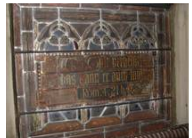
Im Auflicht jedoch wurden massive Probleme mit großflächiger Kaltmalerei deutlich

Zur Abstimmung der Maßnahmen fanden zahlreiche Besprechungen mit dem Bauherrn, dem Planer und dem Landesdenkmalamt statt.