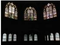
Die östliche Empore mit den Fenstern "Moses auf dem Berg Nebo", "Elias der Prophet" und "Jeremias auf den Trümmern Jerusalems"