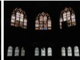
Die westliche Empore mit den Fenstern "Jesus und die Samariterin am Brunnen", "Jesus der Kinderfreund" und "Jesus - Heiland der Kranken und Armen"