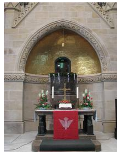
Die Altarapsis ist halbrund gewölbt und vollständig mit Goldmosaik ausgekleidet