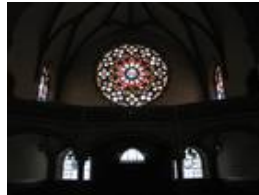
Die südliche Empore mit der mächtigen Rosette Ø ca. 6,6 Meter, den beiden seitlichen Emporenfenstern von Feuerstein; auch die drei Fenster unter dieser Empore wurden von ihm gestaltet