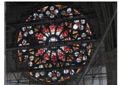
Die Gerüststockwerke verdeutlichen die Mächtigkeit der Südrossette

Die Christuskirche wurde im Verlauf des 2. Weltkrieges, in der Bombennacht vom 2./3. September 1942 beim Großangriff auf Karlsruhe und vom 4./5. Dezember 1944 bei einem erneuten Luftangriff schwer beschädigt. Hierbei kam es neben großen Schäden an Fenstern und Gewölben zu Schäden an der Rosette des Fronteingangs. Sofort nach Ende des Krieges begann man mit dem Wiederaufbau der Kirche. 1984 wurde der Wiederaufbau des ursprünglichen Turmhelms beschlossen, im September 1985 war dies dann realisiert.