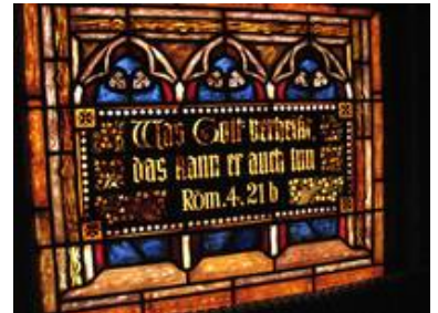
Noch in der Durchsicht zeigten einige Felder wenig von ihren Schäden