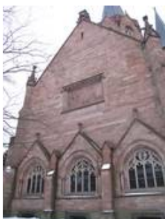
Neben den mächtigen Glasmalereifenstern im Kirchenraum gibt es in der Christuskirche eine Vielzahl weiterer Fenster