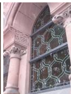
Eines der Feuersteinfenster unter den seitlichen Emporen mit Schutzverglasung im Nachzustand