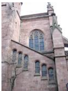
Auch die insgesamt vier Treppenhäuser sind mit einer großen Zahl von Fenstern ausgestattet