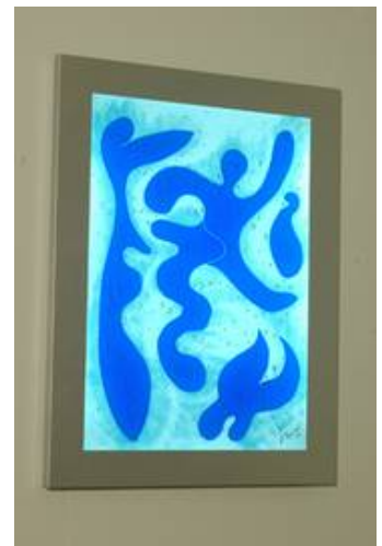
Auch die Lichtbilder in Fusingtechnik von Peter Peppel eignen sich zur individuellen Gestaltung von Räumen ohne Fenster, hier das Motiv Blues