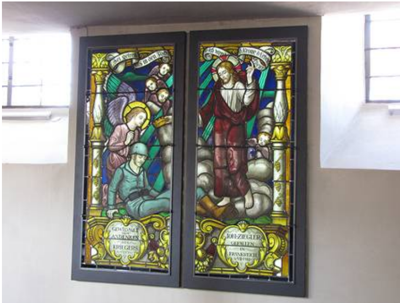
Ob für moderne Glasgestaltungen nach Ihren Wünschen, oder wie hier in Obernbreit bei historischen Glasgestaltungen, unsere Flachlichrahmen bieten Ihnen viele Vorteile.

Trotzdem ist die Lichtverteilung gleichmäßig und die Beleuchtung ist sparsam. Neben Vorteilen im Energieverbrauch wird auch wenig Wärme freigesetzt als bei herkömmlichen Hinterleuchtungen bei denen sich Leuchtstofflampe an Leuchtstofflampe reiht.