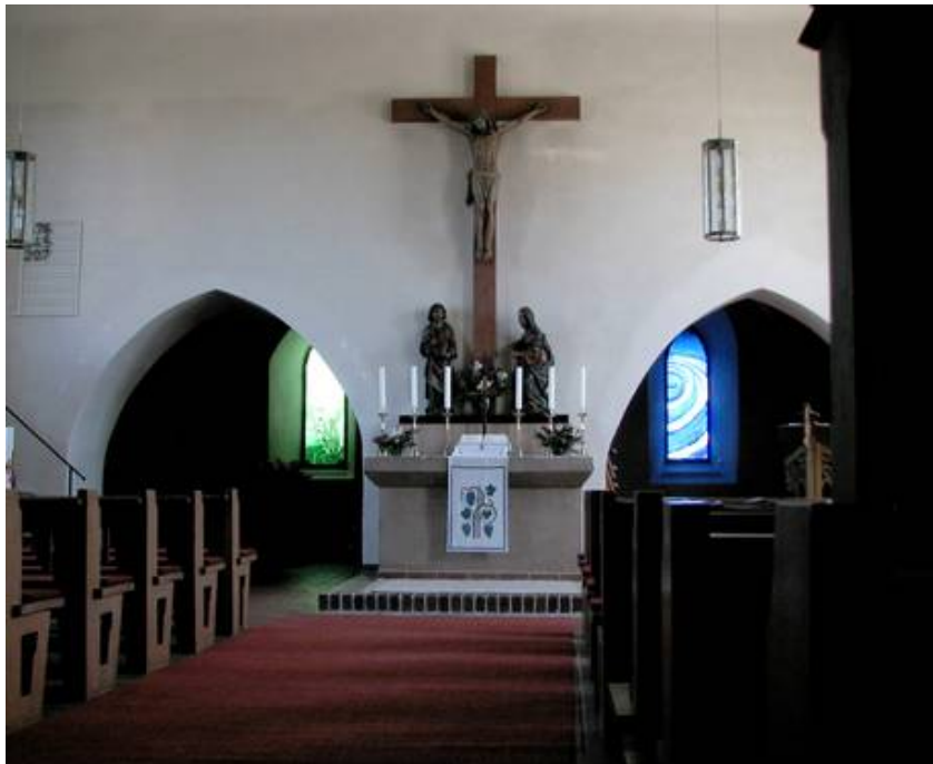
Die beiden Fenster nach dem Einbau in der Kirche