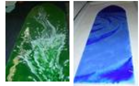
Zwischenstand in der Werkstätte