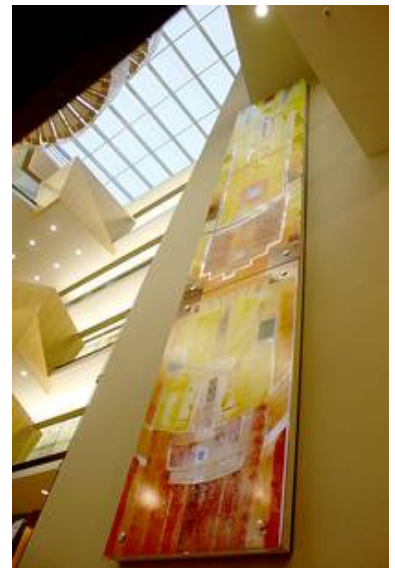
Moderne Glasgestaltung in einem Bürogebäude

Kontaktieren auch Sie uns zur Umsetzung Ihrer Ideen.