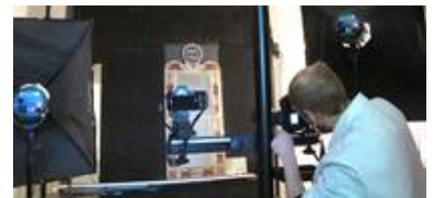
Unsere professionelle Hensel Studioblitzanlage sorgt für das richtige Licht unabhängig vom Tageslicht und für vergleichbare Abbildungen.