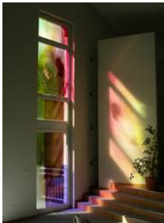
Eine moderne Airbrushglasmalerei von Eberhard Münch in einem Kunststofffenster