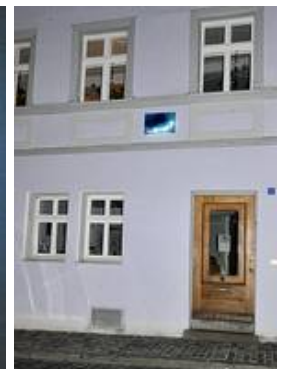
Die Neon-Glasgestaltung in der Fassade

Kleinere Glasgestaltungen wie z.B. Bleiverglasungen im Privatbereich können auch mittels eines aufgeklebten Befestigungsknopf auf eine vorhandene Scheibe montiert werden.