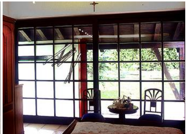
Eine Arbeit von Wladimir Olenburg in einem Schlafzimmerfenster aus Holz

Glasgestaltungen, nicht nur Bleiverglasungen, können auch in eine Isolierverglasung integriert werden.