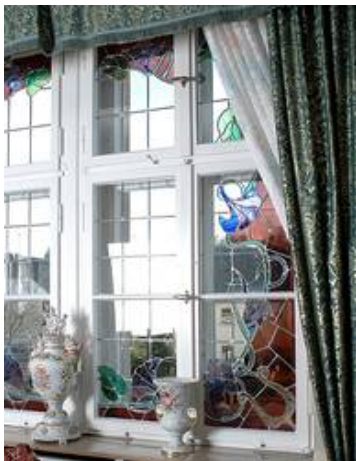
Eine klassische Glasgestaltung in einem klassischen Holzfenster

Die klassische Möglichkeit, ein (Fenster)rahmen der wiederum mit dem Baukörper verbunden ist und den Baukörper abschließt.