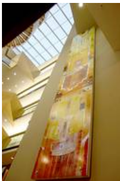
Auch große Gestaltungen wie diese insgesamt 630 cm hohe Arbeit von Jörgen Habedank lässt sich im Punkthalterungen befestigen

Mittels Punkthalter können Glasgestaltungen vergleichsweise unaufdringlich befestigt werden. Punkthalter stellen jedoch erheblich höhere Ansprüche an das Glas selbst.