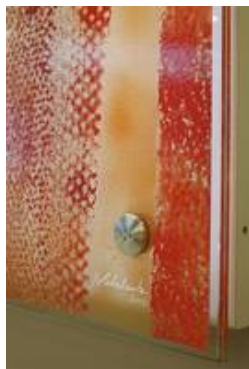
Die Punkthalterungen im Detail, hier ist das Glas dann VSG aus ESG