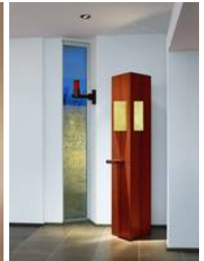
Bei dieser Gestaltung von Karl Decker in Köln werden die Scheiben an der Ober- und Unterkante gehalten.

Mittels Punkthalter können Glasgestaltungen vergleichsweise unaufdringlich befestigt werden. Punkthalter stellen jedoch erheblich höhere Ansprüche an das Glas selbst.