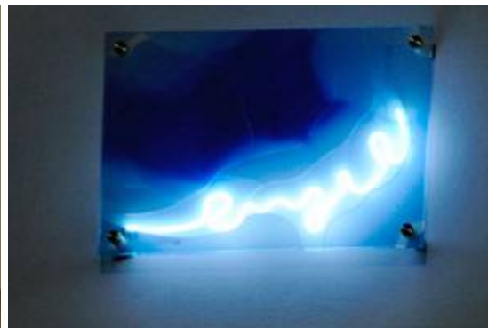
Eine kleine Arbeit von Johannes Schreiber, eine punkthaltene Neon-Glasgestaltung