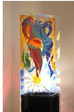
Eine Arbeit von Peter Peppel, hinterleuchtet und an der Unterkante gehalten

Bei größeren Scheiben und Scheiben im öffentlichen Raum sind dann auf jeden Fall Sicherheitsgläser meist in Kombination von VSG und ESG oder TVG zu wählen.